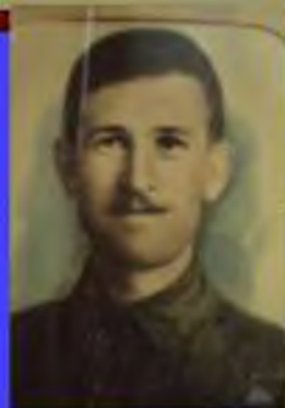
Это папа –