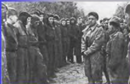
Выступает командир пинского батальона.

Несколько наших катеров подбили, и в бой пошли наши танки, несколько танков подбили немцы, и после этого наши бойцы уже пошли в рукопашную.